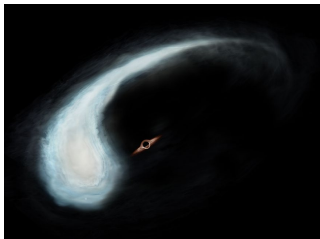
Fig. 2: An artistic depiction of the “Tadpole” orbiting a black hole

The research team from this paper plans to make high-resolution observations using the ALMA 6 . This may allow them to delineate the spatial velocity structure of molecular gas in a Keplerian orbit more clearly. Once this detailed structure is obtained, the scientists hope to determine its precise orbital parameters. In a similar previous study, high-resolution observations have captured emission from the immediate vicinity of a candidate intermediate-mass black hole (Press Release, September 27, 2017). Following these examples, the team’s ALMA observations and search for counterparts may unveil the nature and entity of the point mass that has formed the Tadpole.